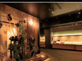
金沢市立安江金箔工芸館