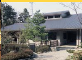
金沢市立中村記念美術館